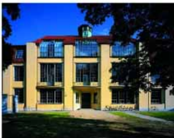
Universidad Birkbeck, Weimar (Alemania)